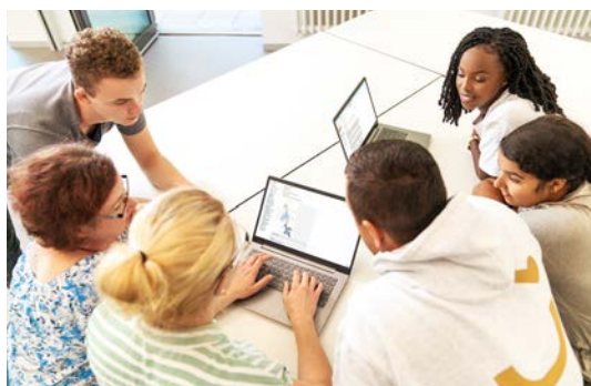
Alle Auszubildenden erhalten ihren eigenen Laptop.