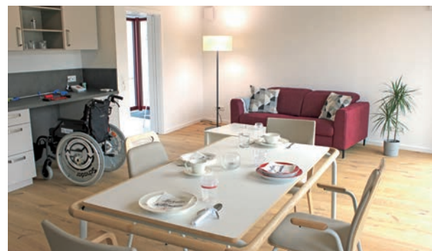
Das Musterhaus in Kürnach zeigt, wie sich ein alters- und behindertengerechtes Zuhause gut mit einem gemütlichen Wohnambiente verbinden lässt.

Kostenlose Beratung in Sachen Wohnen für ältere und behinderte Menschen bietet das KU bereits seit 2014. Mit dem Kürnacher Objekt erweitert es jetzt sein Angebot und verleiht ihm eine ganz neue Klasse. „Hier wird das, was wir in unseren Gesprächen den Seniorinnen und Senioren sowie deren Angehörigen empfehlen, anschaulich, im wahrsten Sinne begreifbar“, so der Leiter von WIRKOMMUNAL im KU. Die umgebaute Bestandsimmobilie im Ortskern orientiert sich an der realen Alltagswelt vieler Menschen, setzt Lösungen für deren typische Problembereiche wie Treppen vor und im Haus, Bäder, Beleuchtung, Mobiliar in Szene. So zum Beispiel, wie