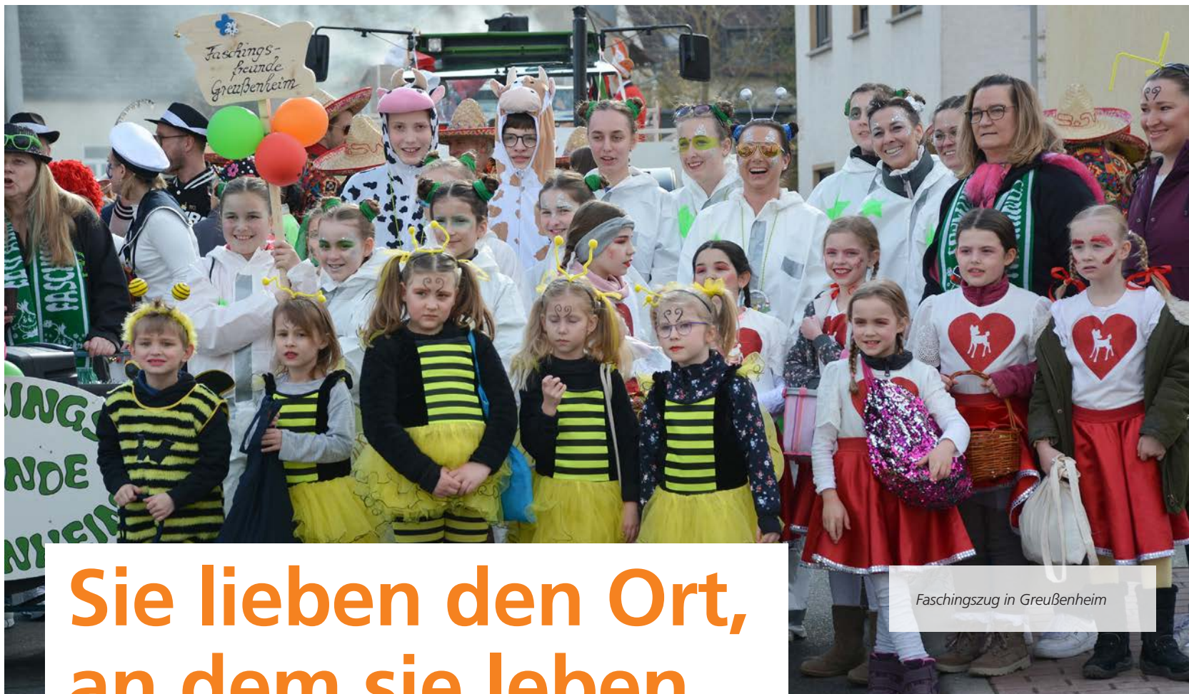
Faschingszug in Greußenheim