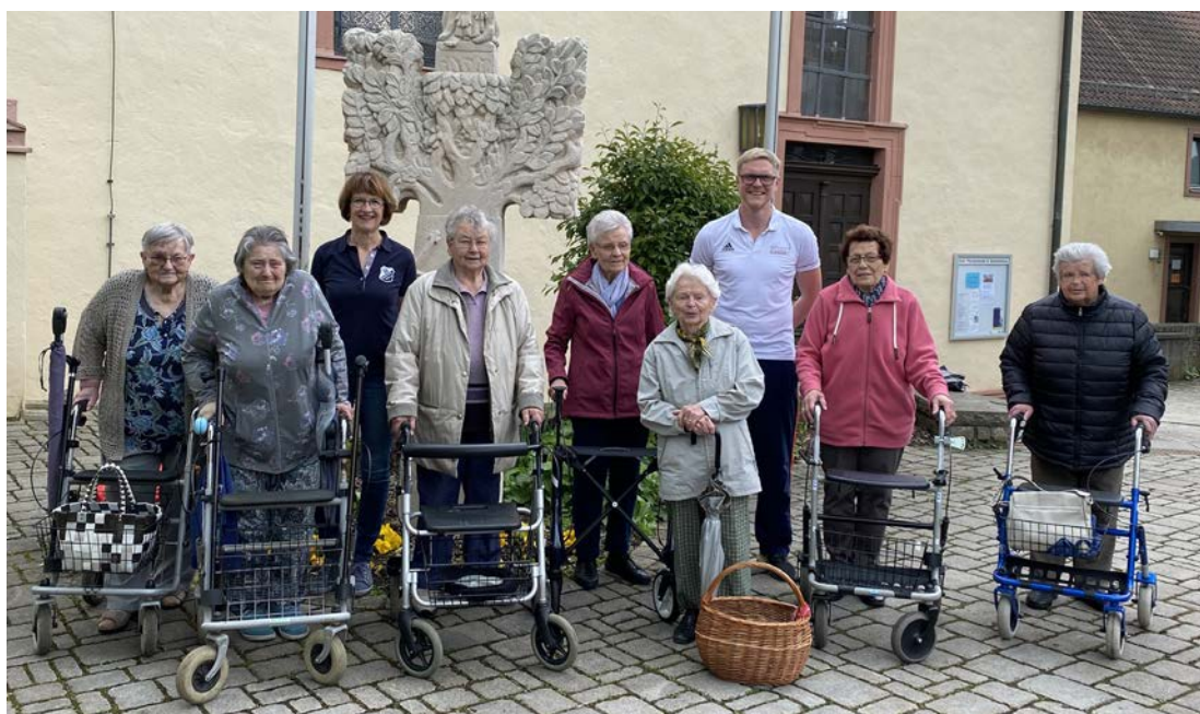
Rollator-Kurs durch den Sportverein Greußenheim