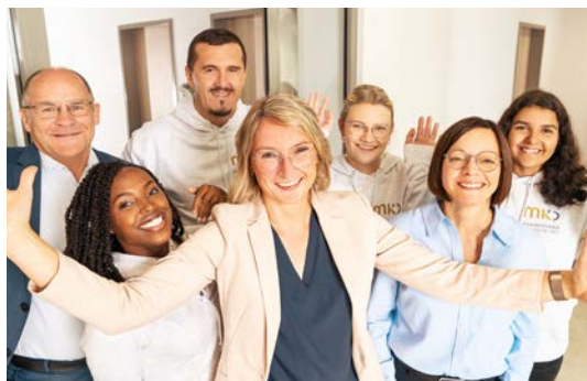
Azubis und Lehrkräfte lernen und lehren auf Augenhöhe.