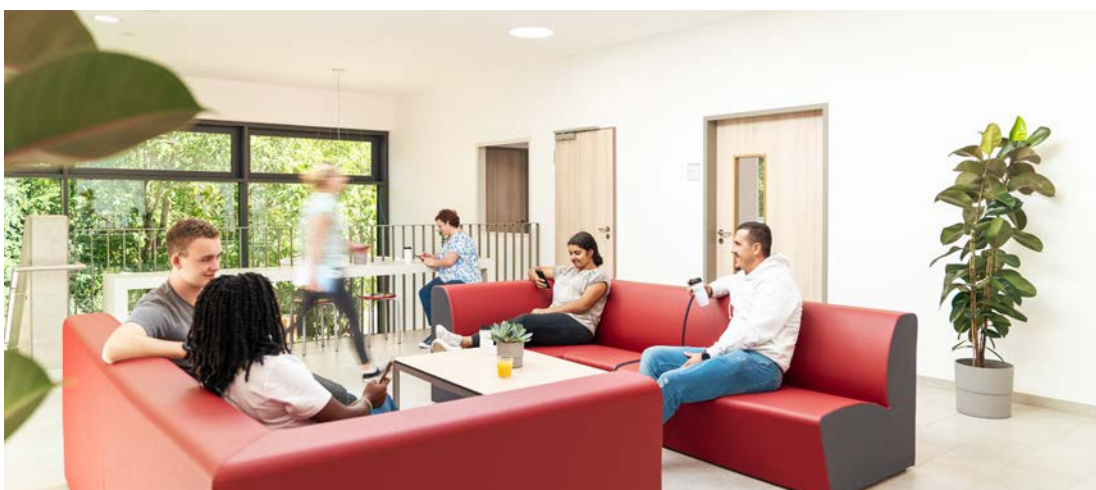
Komfortable Aufenthaltsbereiche zum Entspannen, Lernen und Austauschen