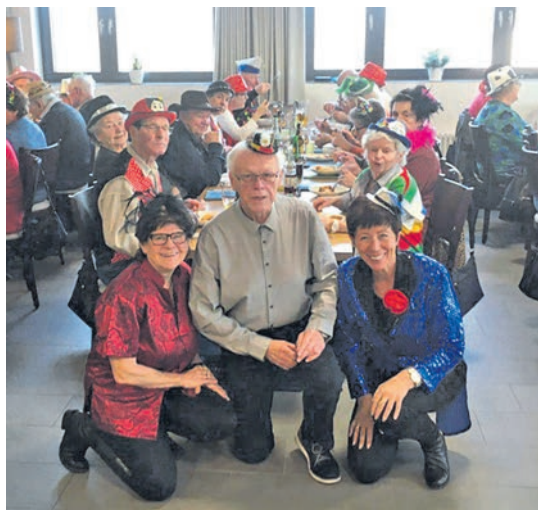
Seniorenfasching in der Pizzeria Nino